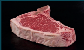
CLUBSTEAK sehr kleiner Filetanteil