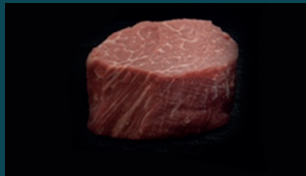
FILET ohne Fett

Diese Methode sorgt für eine gleichmäßige Reifung und erhält die natürliche Feuchtigkeit im Fleisch – so bleibt es besonders saftig. Wet Aged Fleisch ist der gängige Standard in vielen Metzgereien und Märkten.