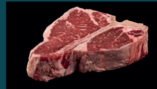
PORTERHOUSE Roastbeef & Filet