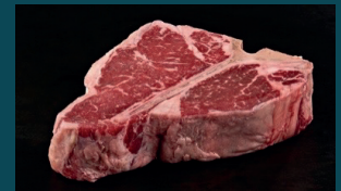
PORTERHOUSE großer Filetanteil