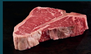
T-BONE mittelgrosser Filetanteil