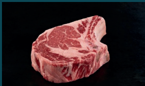
RIB-EYE mit Fettauge